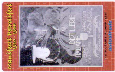
1795 e9/08 (Prima tessera terza parte)

http://digilander.libero.it/PubblicoMil/