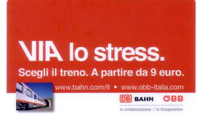
1869 e11/11 (Ultima tessera terza parte)